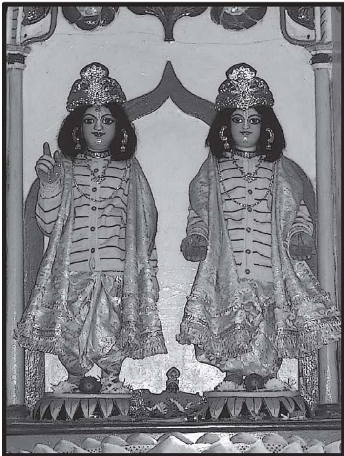
चम्पकहट्टमें सेवित श्रीश्रीगौर-गदाधर